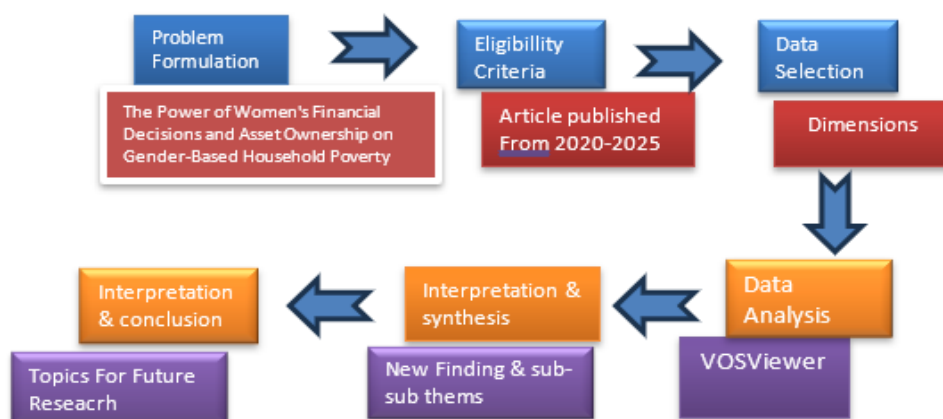
Gambar 1. Prosedur penelitian

Kriteria kelayakan data dalam penelitian ini ditetapkan untuk memastikan bahwa hanya literatur yang relevan dan berkualitas tinggi yang dianalisis. Kriteria tersebut meliputi (1) artikel ilmiah yang diterbitkan dalam jurnal nasional dan internasional bereputasi; (2) studi yang secara khusus membahas Kekuatan Keputusan Finansial Perempuan dan Kepemilikan Aset terhadap Kemiskinan Rumah Tangga Berbasis Gender; (3) publikasi yang diterbitkan dalam 5 tahun terakhir (2020-2025); (4) artikel yang tersedia dalam bentuk teks lengkap dan dalam bahasa Inggris atau bahasa Indonesia. Prosedur penelitian seperti yang ditunjukkan pada Gambar 1.