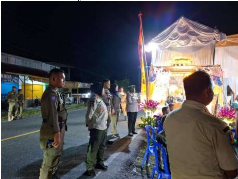
Gambar 2 - Penindakan Kegiatan Pembatasan Jam Hiburan Malam di Acara Baralek

Penindakan tegas oleh Satpol PP pada acara baralek (pesta pernikahan) di salah satu nagari di Kecamatan Lubuk Alung, di mana kegiatan hiburan seperti kim dan orgen tunggal dilaksanakan pada malam hari. Berdasarkan pengamatan, kegiatan tersebut dihentikan oleh aparat Satpol PP sekitar pukul 23.45 WIB karena dianggap telah melanggar ketentuan jam malam. Pihak tuan rumah dan panitia acara tampak kooperatif dan menghentikan kegiatan secara sukarela setelah diberikan penjelasan oleh petugas. Namun demikian, beberapa warga yang hadir mengungkapkan kekecewaannya karena acara hiburan yang seharusnya menjadi sarana rekreasi dan kebersamaan harus diakhiri lebih cepat dari kebiasaan sebelumnya.