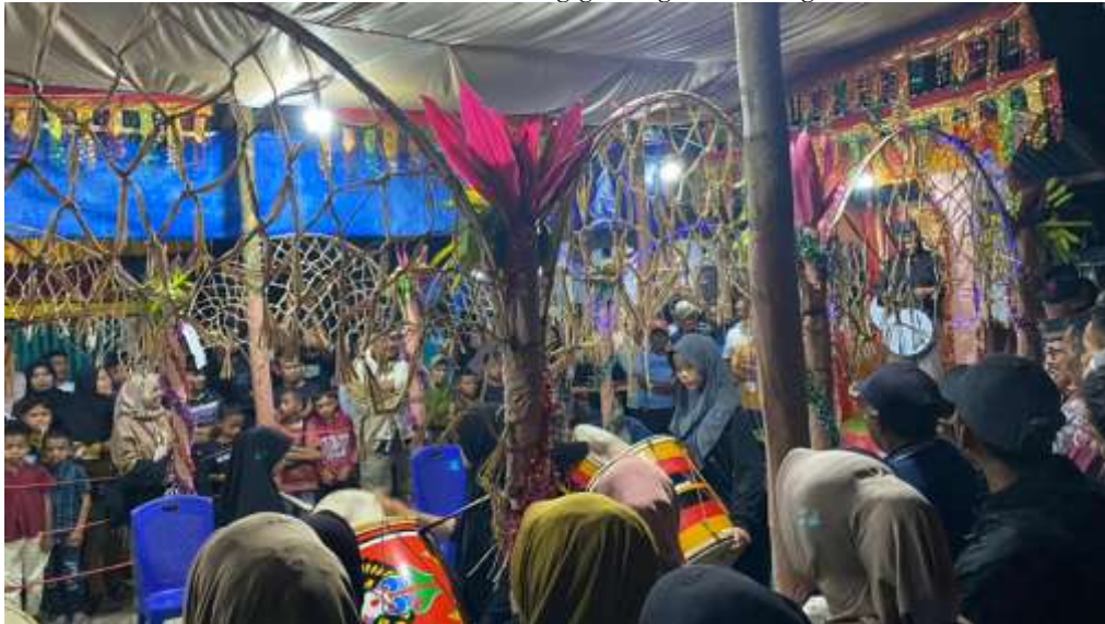
Gambar 3 - Acara Festival Gandang-gandang Tasa di Sungai Asam

Kesenian seperti indang, randai, dan tambu tasa secara turun-temurun dilaksanakan pada malam hari sebagai media silaturahmi, penyampaian pesan adat, dan dakwah. Bagi mereka, pembatasan waktu berarti mengurangi makna dan keutuhan pesan budaya yang terkandung dalam pertunjukan tersebut.